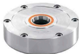
Ø120 2500 kgf