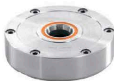
Ø90 1250 kgf