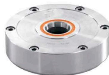
Ø190 6000 kgf